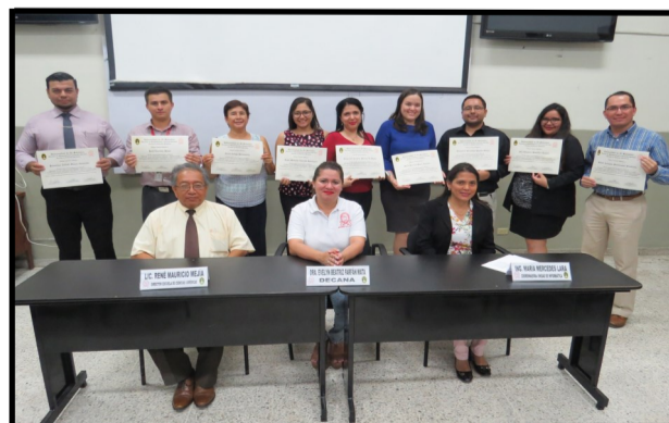
Grupo de profesionales del Diplomado