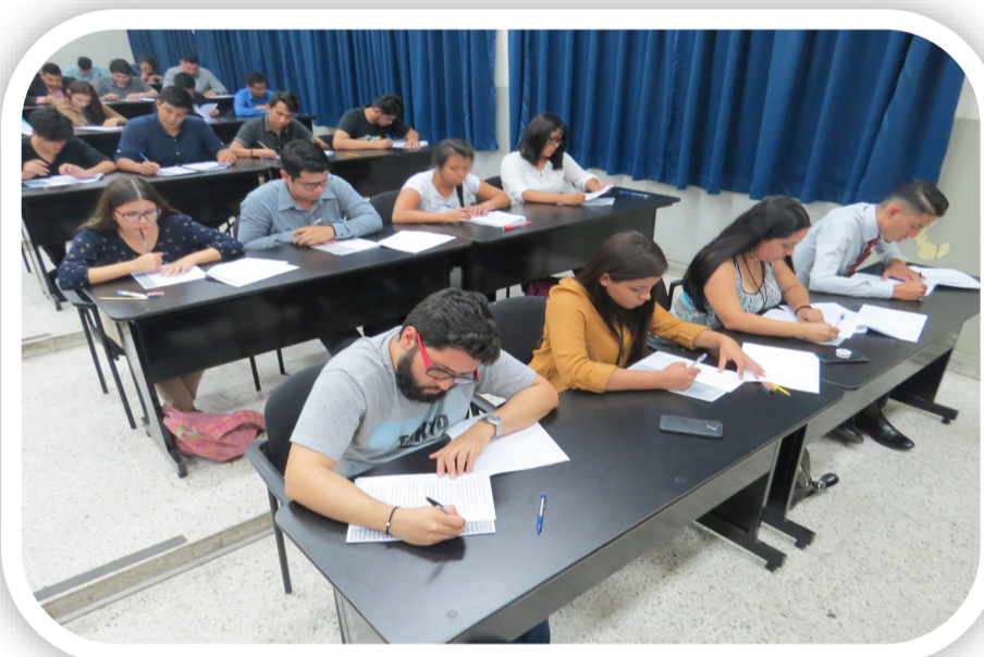
Estudiantes de Ciencias Jurídicas y de Relaciones Internacionales realizan prueba de conocimientos y aptitudes

En el sentido de dar cumplimiento al Reglamento para la Ejecución y Desarrollo del programa de Auxiliares de Cátedra de la Universidad de El Salvador, estudiantes de Ciencias Jurídicas y Relaciones Internacionales, realizaron la prueba de conocimientos y aptitudes para Aspirantes de Catedra, Ciclo II-2019. Según el Artículo 7, los estudiantes deberán someterse y aprobar las evaluaciones de conocimiento y aptitud a fin de cumplir los requerimientos que exijan las Escuelas, Departamentos o Áreas de cada Facultad; en ese sentido, un total de 41 bachilleres asistieron a la evaluación para alcanzar una de las cinco plazas disponibles en: Derecho Penal I y II, Derecho Procesal Penal I y II, Derecho Administrativo, Introducción a la Investigación Social II y Economía de El Salvador, de la Escuela de RR.II.