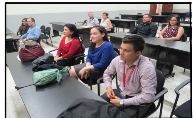
Auxiliares de Cátedra asisten a la Clausura