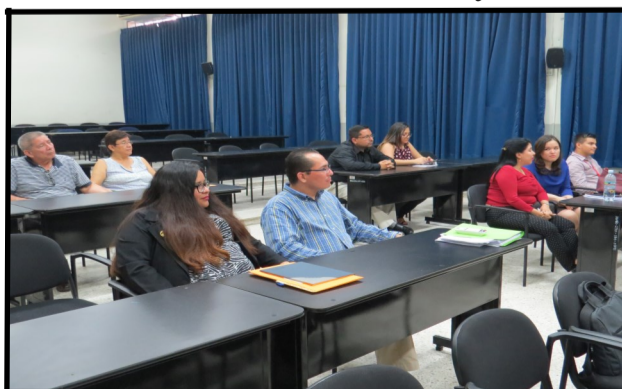
Actos de clausura del Diplomado

En los actos de clausura las autoridades reflexionaron respecto a que este tipo de enseñanza requiere mucha participación, interacción y compromiso.